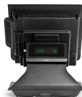
Pantalla VFD de 2x20