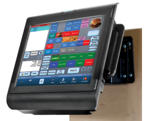
Montaje a la pared