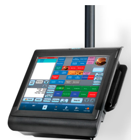
Montaje en cielorraso